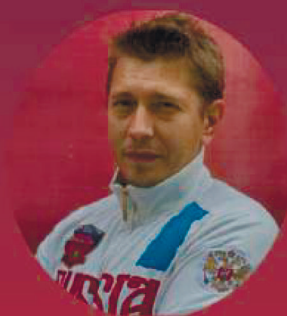
АЛЕКСАНДР СОРОКИН ПРЕЗИДЕНТ