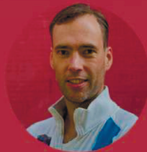
БОРИС ЖАРКИЙ РЕВИЗОР